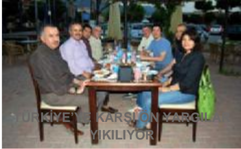
TÜRKİYE'YE KARŞI ON YARGILANLARI YIKILIYOR