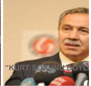
“KURT SORUNU BOYL

ANASAYFA GÜNCEL SİYASET EKONOMİ SPOR YAŞAM EĞİTİM SAĞLIK MEDYA KÜLTÜR SANAT