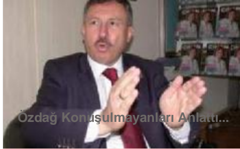
Özdağ Konuşulmayanları Anlattı...